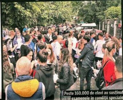
Peste 160.000 de elevi au susținut examenele în condiții speciale

Primele rezultate la examenul Evaluării Naționale vor fi comunicate luni, 22 iunie, până la ora 14:00 (în centrele de examen). Contestatiile pot fi depuse în zilele de 22 iunie (în intervalul orar 16:00 – 19:00) și 23 iunie (în intervalul orar 8:00 – 12:00). Acestea pot fi depuse/transmise și prin mijloace electronice. Rezultatele finale vor fi afișate sâmbătă, 27 iunie. ●