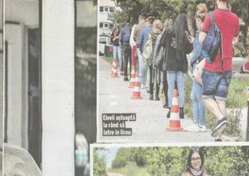
Elevii intră în școală în fiecare zi. Este însoțită de părinți și de un profesor de la școală.