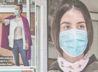
Accident medical în liceul din Craiova