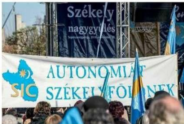
După "scăparea" din Camera Deputaților, proiectul de lege privind autonomia Ținutului Secuiesc este așteptat, pentru a fi respins, în Senat

La nivel de întindere, potrivit proiectului de lege, actualele județe Covasna și Harghita, cât și o parte a județului Mureș, denumit generic "scaunul istoric Mureș", ar putea defini componența Ținutului Secuiesc autonom, după cum urmează: Scaunul Kézdi (Kézdiszék), care cuprinde localitățile aparținătoare, având reședința la Târgu Secuiesc (Kézdivásárhely), Scaunul Orbai (Orbaiszék), care cuprinde localitățile aparținătoare, având reședința la Covasna (Kovászna), Scaunul Seps (Sepsiszék), care cuprinde localitățile aparținătoare, având reședința la Sfântu Gheorghe (Sepsiszentgyörgy), Scaunul Ciuc