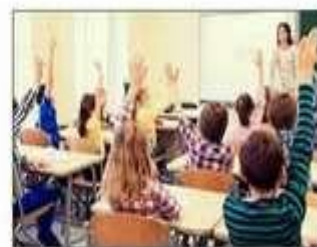
În prezent, sunt 3 milioane de elevi care nu se pot întoarce la școală

O altă problemă iscată de această situație în care școlile vor rămâne închise până în toamnă este cea a