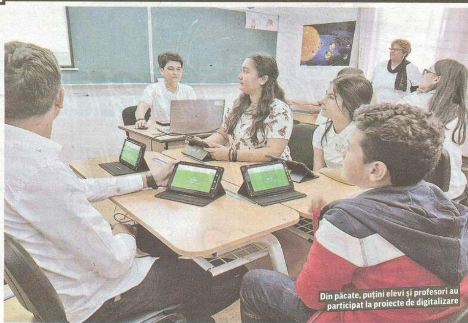
Din păcate, puțini elevi și profesori au participat la proiecte de digitalizare

Și elevii spun că majoritatea orelor online nu sunt, în realitate, lecții, ci mai mult o