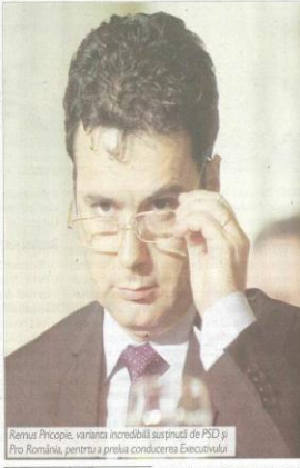
Remus Pricopie, varianta incredibilă susținută de PSD și Pro România, pentru a prelua conducerea Executivului

Reactor al SNSPA, instituție care a găzduit, în noaptea, asociații „dezbateri” electorale a lui Klaus Iohannis, Remus Pricopie este nominalizat PSD și Pro România pentru funcția de prim-ministru, după ce aceleși două partide au reușit să răstoare, prin mișcare de ceară, guvernul condus de Liviu Dragnea. Propunerea este una mai mult decât uvertivă, având în vedere că Remus Pricopie, un eminent profesor, are, conform iscrilor publice din ultimul an, poștii aproape identice cu cele ale USR și PNL. Pe pagina sa de Facebook există numeroase postări în care îl critică vehement pe fostul lider PSD Liviu Dragnea, descoperindu-l luptă împotriva statului paralel și este de părere că Secția pentru Investigarea Infraținilor din Justiție nu trebuie să existe. Mai mult, Remus Pricopie este un susținător al lui Călin Tatomir, director general al Parchetului European, iar asistenta de învățământ superior pe care o conduce, totuși a fost inițiat să facă parte dintr-o rețea internațională finanțată de George Soros. Premierul propus de PSD și Pro România este, însă, un fost partener de afaceri al lui Călin Tatomir, directorul companiei Microsoft arstat în 2016, și trimis în judecată în 2017, de către DNA, condusă chiar de Kovesi, pentru o fraudă cu licențe IT, din care sunt cecetate celebrele deși Dinu Pescariu și Claudia Florică.