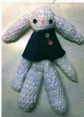
Adolescenta face și creații handmade, inclusiv jucării