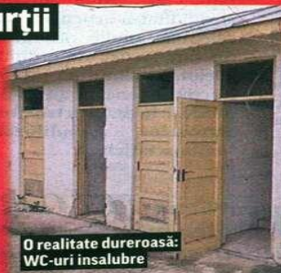
O realitate dureroasă: WC-uri insalubre

tierul Titan (sectorul 3). Proiectul-pilot a fost inițiat de Primăria Capitalei, iar autobuzele STB vor circula în perioada cursurilor, nu și în vacanțe ori în zilele libere ale elevilor. ● Rezultate finale. Rata de promovare înregistrată în sesiunea august-septembrie a examenului de Bacalaureat 2019, după soluționarea contestațiilor, este de 33,4%, în creștere cu 3,7%, comparativ cu sesiunea de toamnă a anului trecut (29,7%), potrivit datelor centralizate de Ministerul Educației Naționale (MEN).