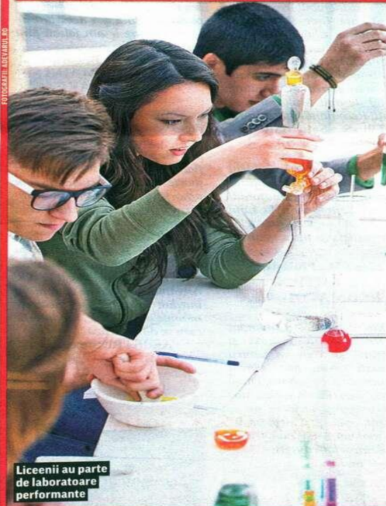
Liceenii au parte de laboratoare performante

După o investiție de șase milioane de euro, Liceul Tehnologic «Ștefan cel Mare» din Vorona e cel mai modern din mediul rural