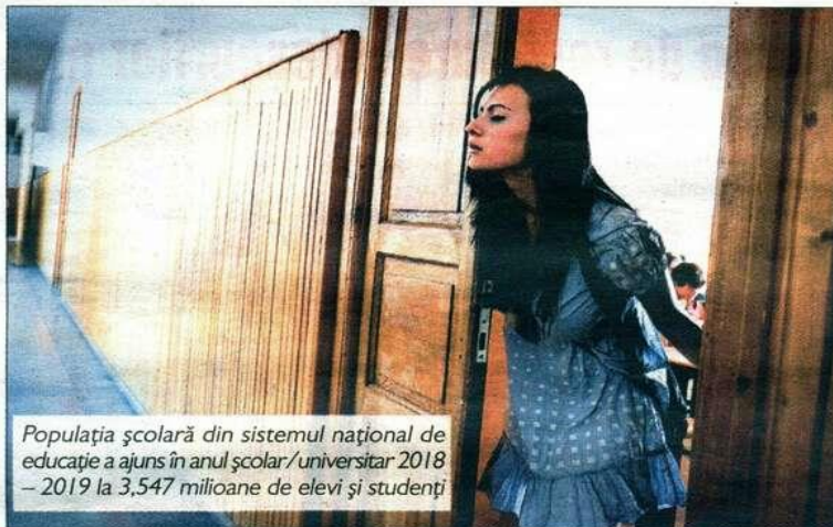
Populația școlară din sistemul național de educație a ajuns în anul școlar/universitar 2018 – 2019 la 3,547 milioane de elevi și studenți

În același raport, apare și eliminarea impozitului pentru veniturile mai mici de 2.000 de lei obținute de familiile cu copii.