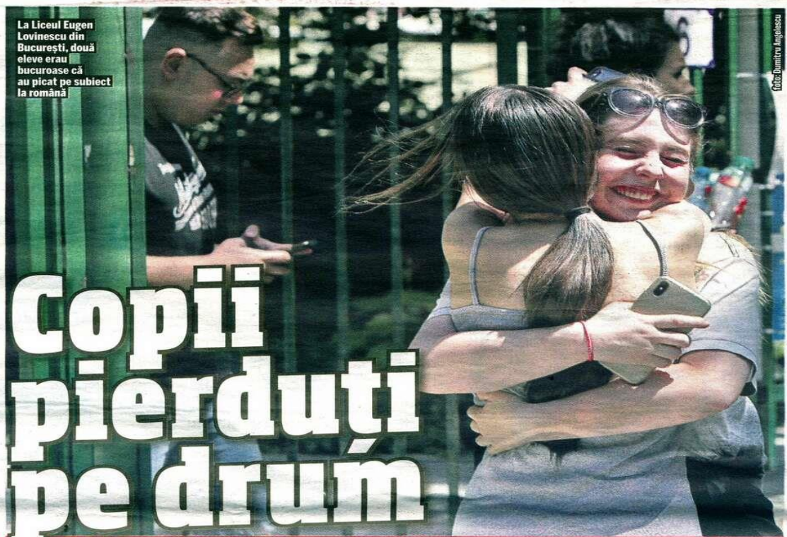
La Liceul Eugen Lovinescu din București, două eleve erau bucuroase că au picat pe subiect la română