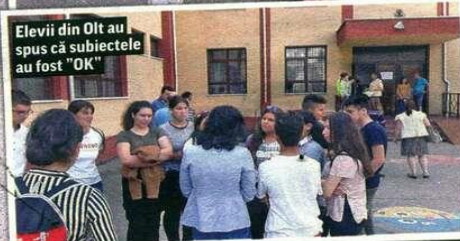
Elevii din Olt au spus că subiectele au fost "OK"

A început examenul de Evaluare națională pentru absolvenții de gimnaziu, cu proba la Română. Însă părinții au avut emoții mai mari. "Avem copii buni, vor lua note mari", s-a încurajat reciproc rudele adunate la gardul școlilor.