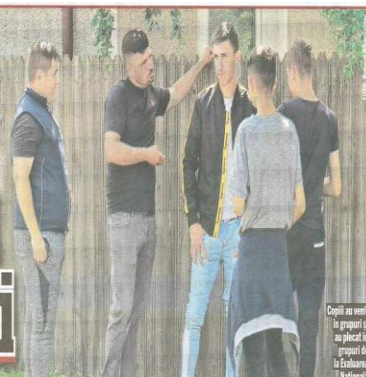
Copiii au venit la grupuri și au plecat în grupuri de la Evaluarea Națională

În poarta Școlii Gimnaziale Marin Preda din Șiliștea Gumești, tăcut în timule sport și mămică în colanți și bluze de vară își încurajează candidații la Evaluarea Națională. Dar cei mai mulți dintre cei 30 de elevi vin fără însoțitor, în grupuri mai mici sau mai mari. Se adună în curtea școlii, pășesc agale prin tarba înaltă când directoroa în cheamă în clase.