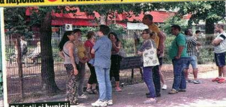
Părinții și bunicii au așteptat la gardul școlii

➔ Aproape 155.000 de elevi de a opta au dat ieri prima probă scrisă la Evaluarea națională ➔ Mai multe emoții au avut părinții și bunicii