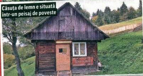
Căsuța de lemn e situată într-un peisaj de poveste