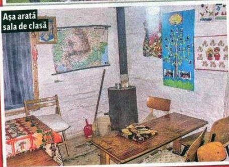
Așa arată sala de clasă

După un drum de 5 kilometri, micuții au ajuns într-o cămăruță de lemn gata pentru prima oră