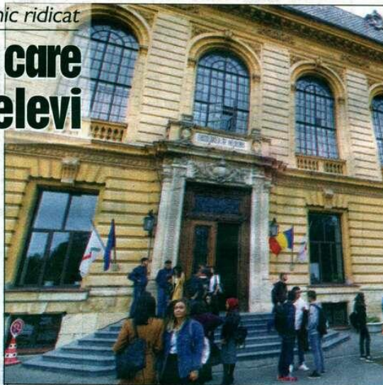
UMF „Carol Davila” din București a primit, în anul universitar 2018-2019, aproape 1500 de noi studenți

de clădiri bucureștene ar avea avarii semnificative. Peste 1.000 de imobile s-ar prăbuși total sau parțial.