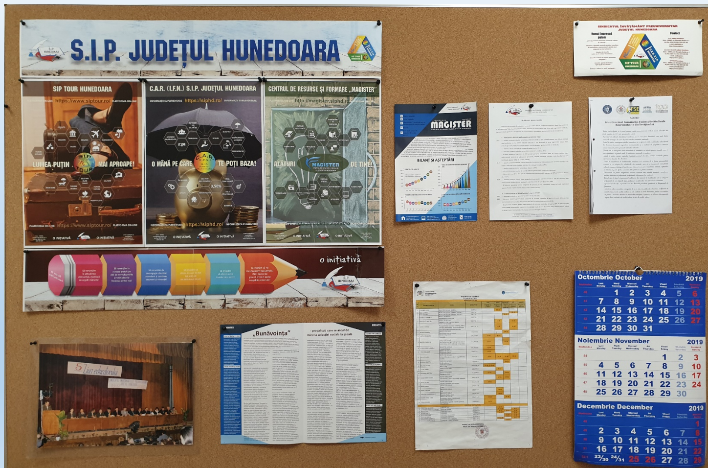
Sediul S.I.P. Județul Hunedoara